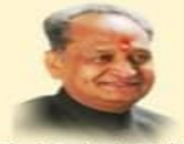
Shri Ashok Gehlot Hon'ble Chief Minister Rajasthan