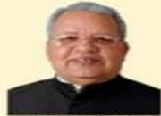
Shri Kalraj Mishra Hon'ble Governor Rajasthan