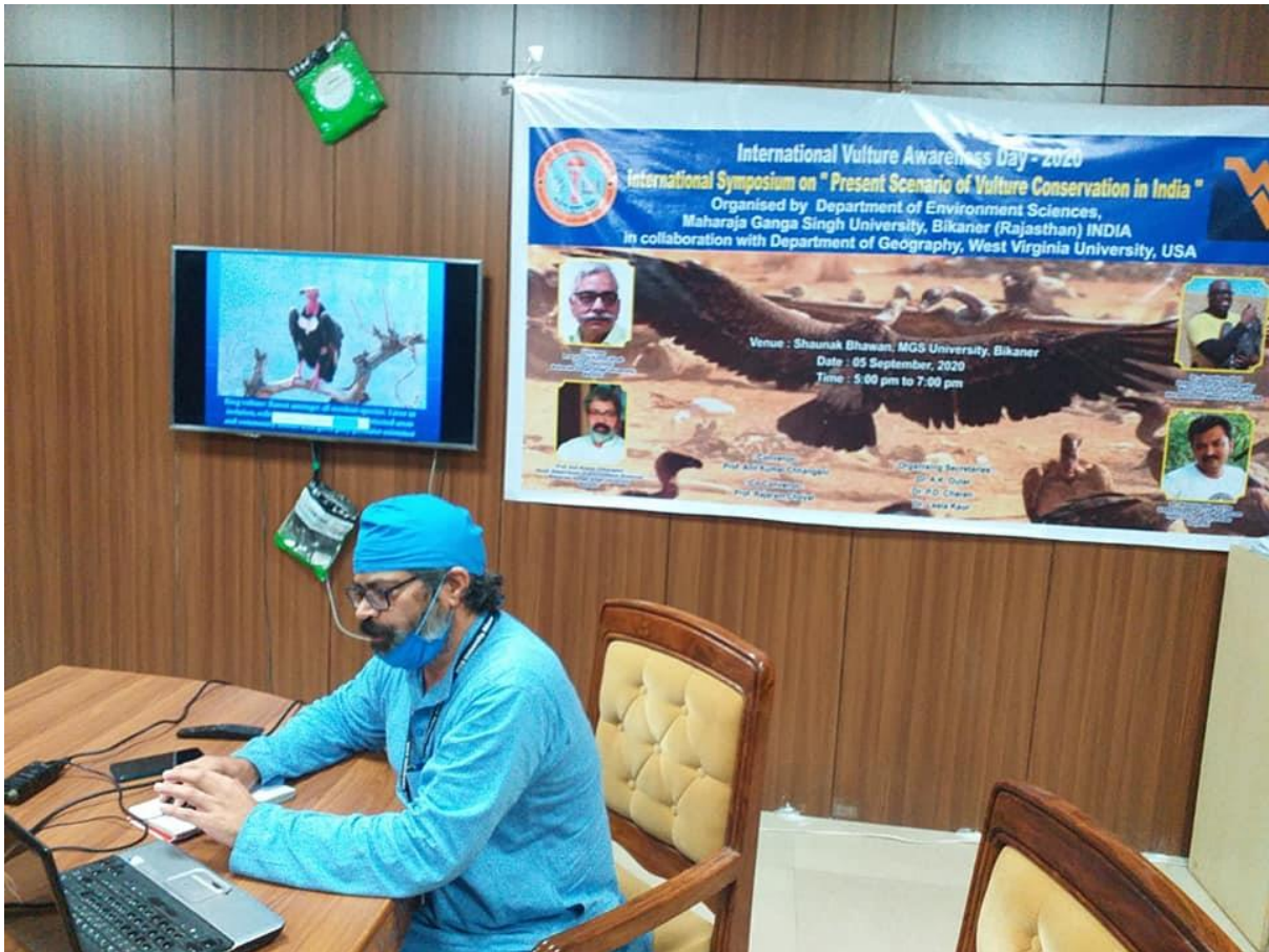
International Vulture Awareness Day- 2020. (5 September 2020)