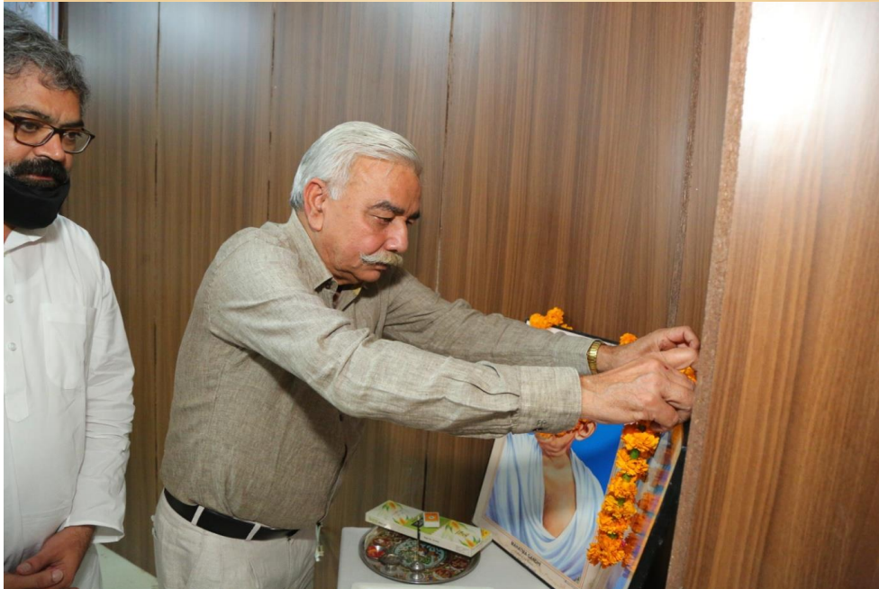
02 Oct. 2021 Celebration of 152th Gandhi Jayanti