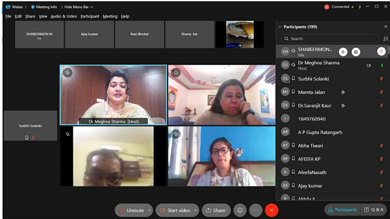
7.1.1 Webinar Screenshot on 23 June 2021