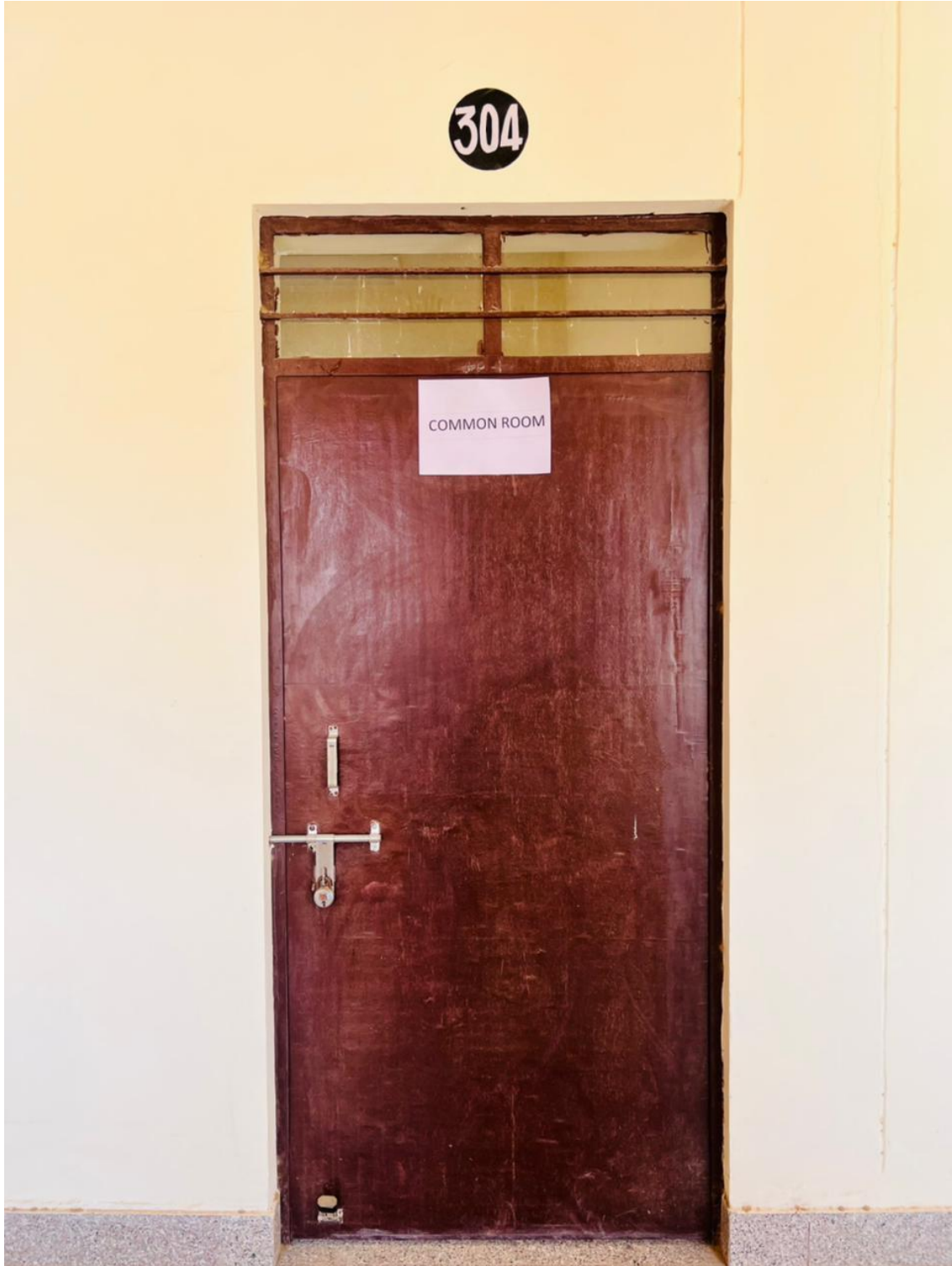
7.1.1 Common Room for Girls