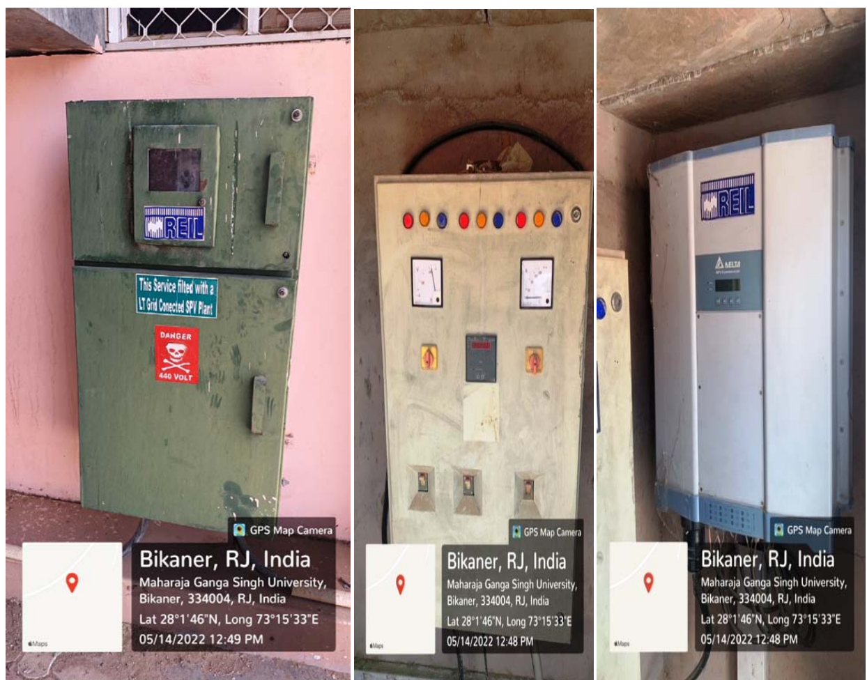
100kwp Grid connected SPV Power