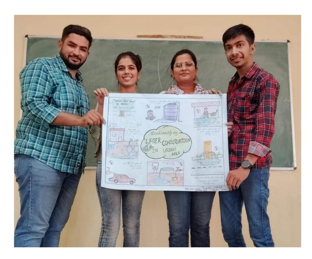
Poster Making Competition