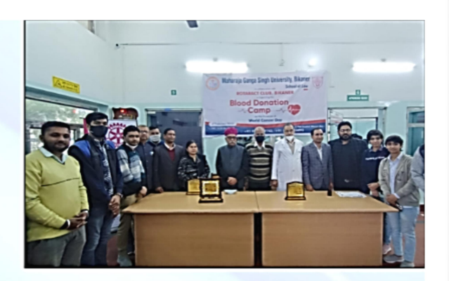
०४ फरवरी २०२२ विश्व कैंसर दिवस पर स्कल ऑफ लॉ द्वारा आयोजित रक्तदान शिविर