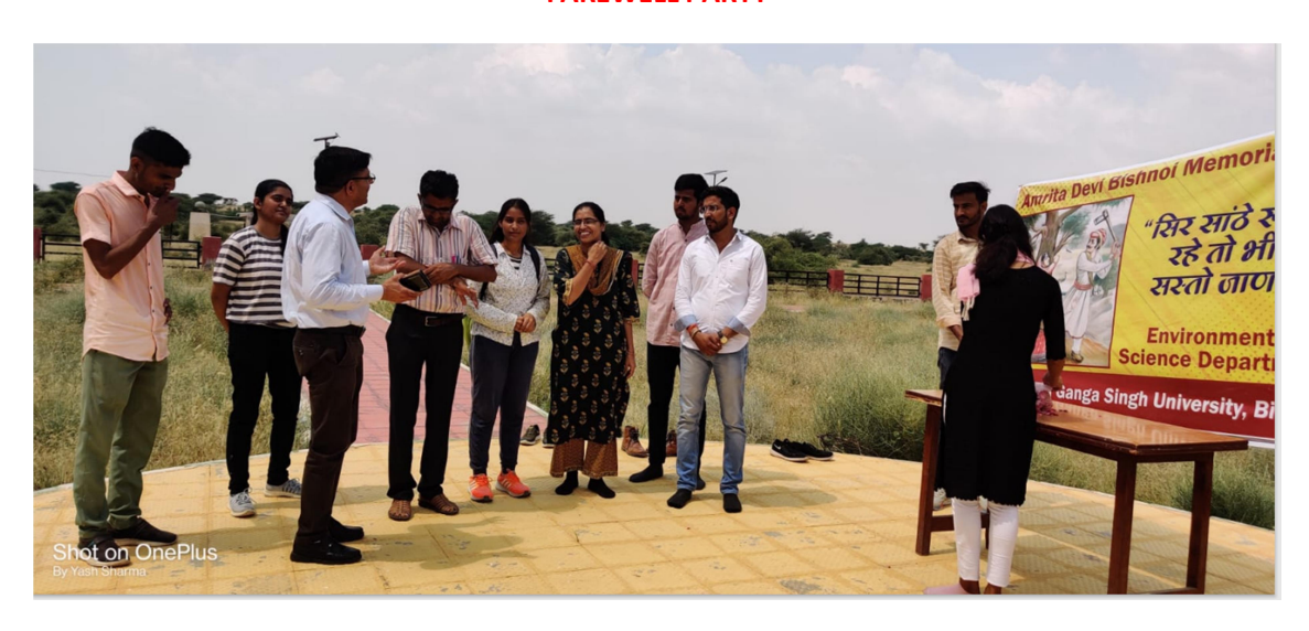
Environmental Conservation Day